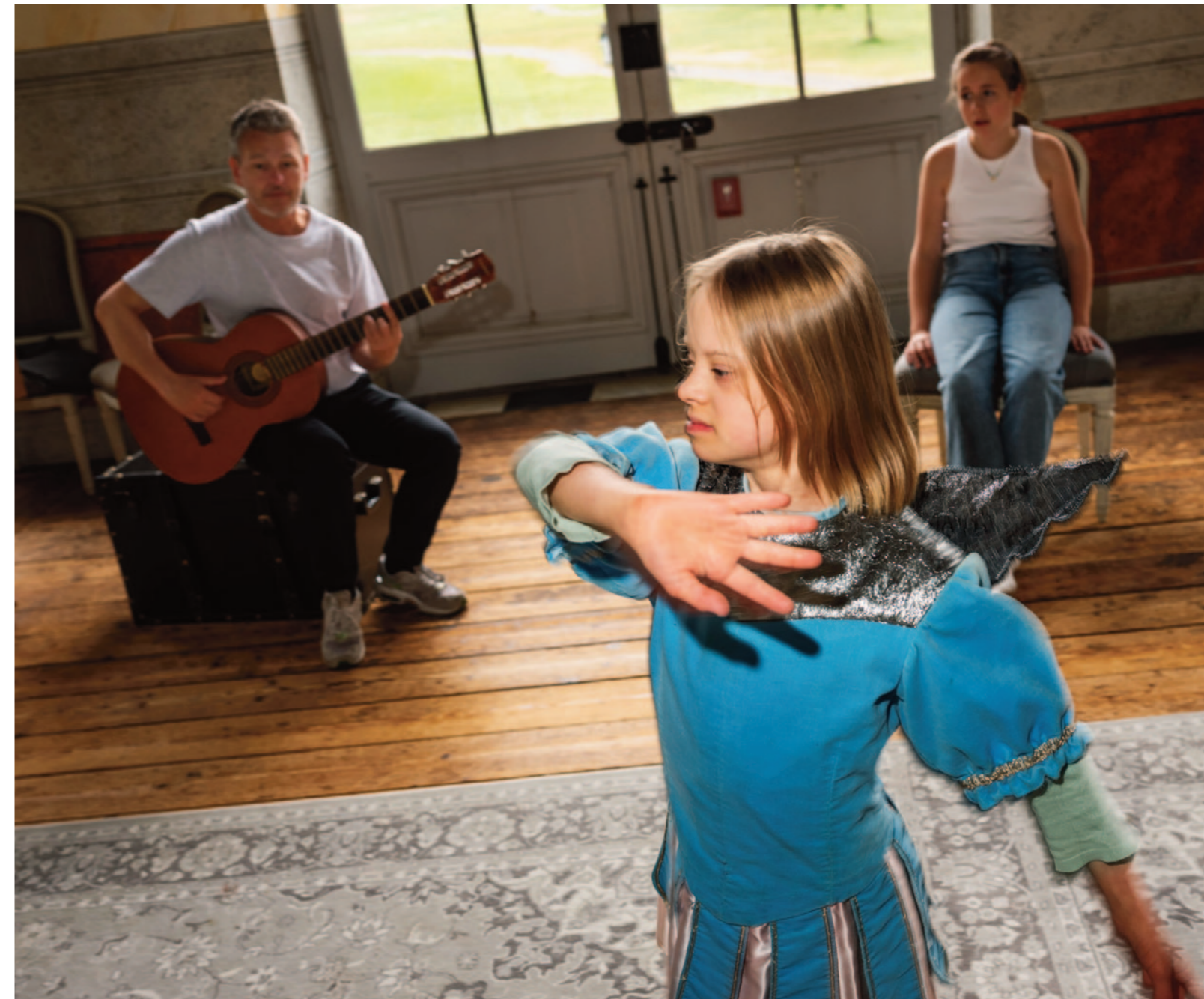
Knyt an till det som tar sig i uttryck. Fånga i flykten det som visar sig och möta upp det som händer, förstärka, förankra och våga stanna kvar i det som sker.

Vår målsättning och förhoppning var att ge verktyg och idéer som kunde stimulera varje barns förmåga att klä tankar, fantasi och känslor i egna ord, ljud eller rörelse. Detta så att meningsfulla sammanhang kunde skapas. Ett meningsfullt sammanhang, menar vi, består av att ge utrymme och välkomna det egna uttrycket och den egna personligheten, tanken och viljan.